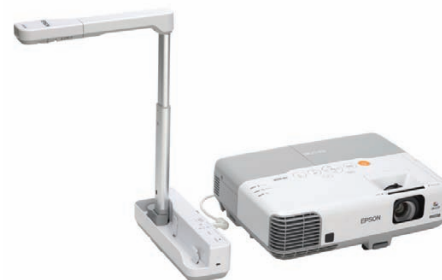
Partagez des objets en 3D avec le visualiseur de document ELP-DC06